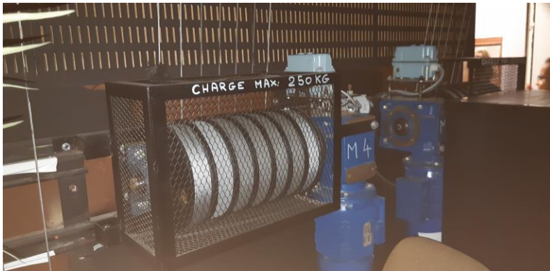
La machinerie du plateau (la scène)